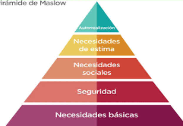
Pirámide de Maslow https://blog.hubspot.es/marketing/piramide-maslow-marketing