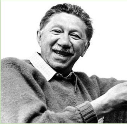
Abraham Maslow https://es.wikipedia.org/wiki/Abraham_Maslow