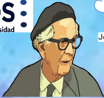
Jean William Fritz Piaget