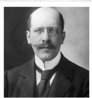
Teoría de las relaciones humanas de Elton Mayo (1890-1947).

Esta teoría surgió como resultado de los experimentos realizados en la planta Hawthorne de la Western Electric Company en Chicago. Las conclusiones del experimento que coordinó Elton Mayo, iniciado en 1927 y terminado en 1932, cambiaron el pensamiento administrativo que hasta entonces estaba enfocado en las tareas sin tomar en cuenta a las personas.