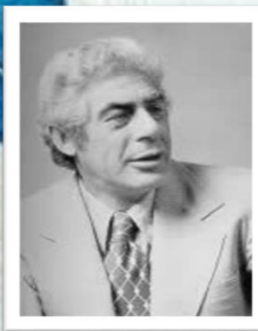
Herzberg Frederick (1923-2000).

Propuso la teoría de los dos factores que determinan el comportamiento de las personas en situaciones laborales.