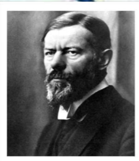
Teoría burocrática de Max Weber (1864-1920).

Weber fue uno de los fundadores de la sociología moderna; contribuyó al pensamiento económico, social y administrativo, fue contemporáneo del movimiento de la administración científica, así como de las primeras fases del pensamiento de la teoría del proceso administrativo.