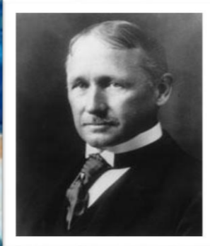
Teoría administrativa científica de Taylor Frederick W. Taylor (1856-1915).

Se le conoce como el "padre de la administración científica" y es la persona que ha ejercido mayor impacto en el desarrollo inicial de la administración. Su enfoque fue aplicar los métodos de la ciencia a los problemas de la administración, sin perder de vista que los principales métodos científicos son la observación y la medición, con los que desarrolló la administración científica.