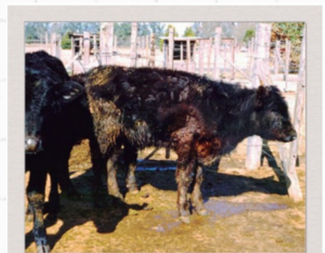
Cuadro avanzado de gastroenteritis parasitaria en invierno