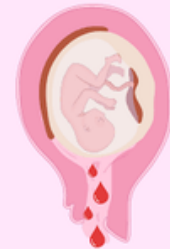
Sangrado vaginal leve