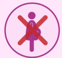
Reducción síntomas embarazo