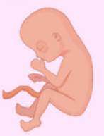
Inferior a 500 gramos