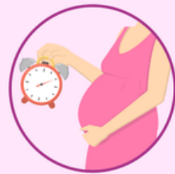
Antes de la semana 20

Es la pérdida espontánea de un feto antes de la semana 20 del embarazo. La pérdida del embarazo después de 20 semanas se llama muerte fetal. Un aborto espontáneo es un suceso que ocurre naturalmente, a diferencia de los abortos médicos o abortos quirúrgicos.