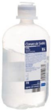
PHYSIOLOGICAL SALINE SOLUTION