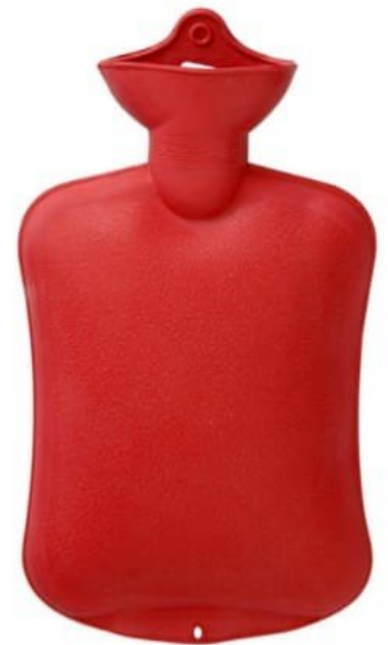
WARM WATER COMPRESSES