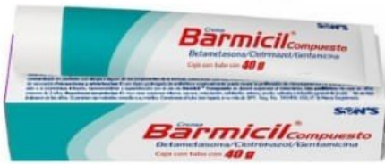
CREAM FOR INFLAMMATION