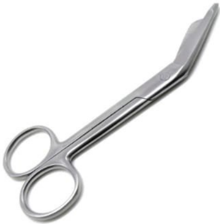
SCISSORS TO CUT BANDAGES