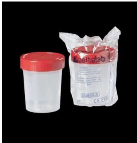
CLINICAL SAMPLE BASE