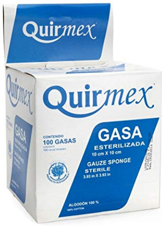
STERILE GAUZE DRESSING