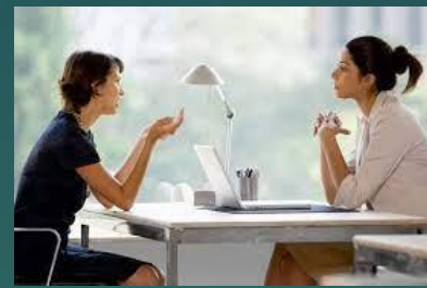
Ejecutadas de persona a persona

Entrevista estructurada y no estructurada