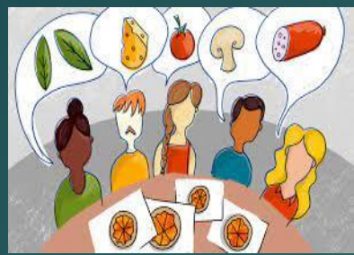
Llamados grupos de discusión

Permite situarse entre: ✓ El testimonio subjetivo ✓ La plasmación de una vida es reflejo de una época