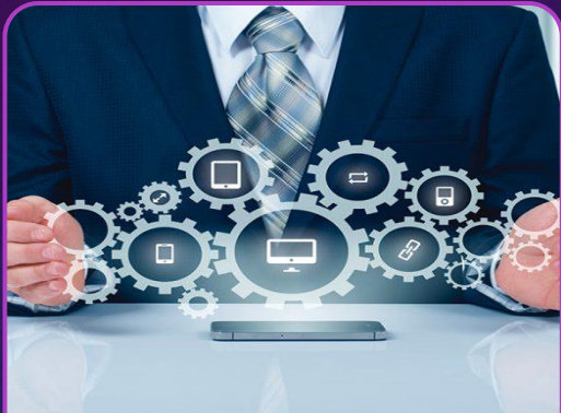
Diagnostico y evaluacion