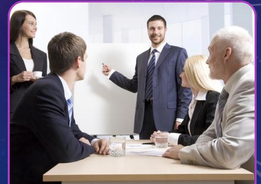
Toma de desiciones