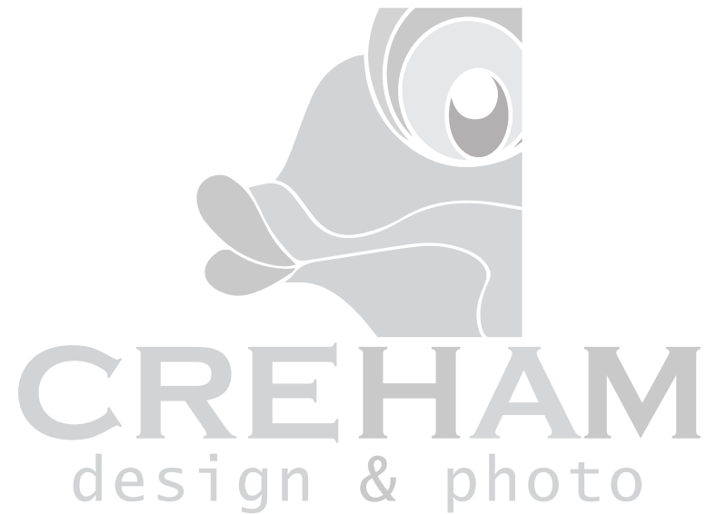
ESCALA DE GRISES AL 35%