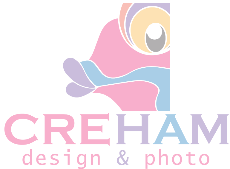
MARCA DE AGUA AL 35%

Para la marca de agua y escala de grises se usará al 35%.