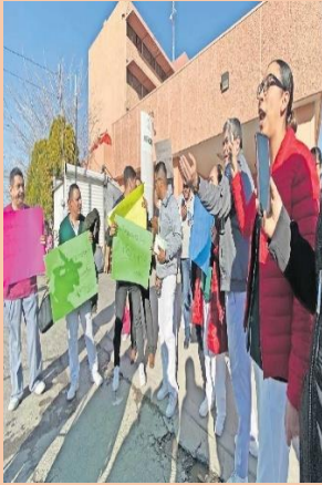
conflictos del imms - Bing images