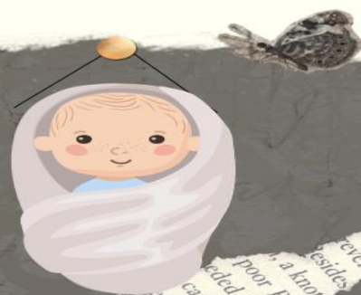
Pruebas con lactantes e infantes

Las pruebas con lactantes e infantes son diferentes. Dado que los bebés no pueden decirnos lo que saben y cómo piensan, la manera más obvia de estimar su inteligencia es evaluando lo que pueden hacer.