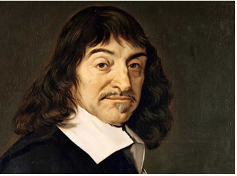
Filósofo francés, René Descartes