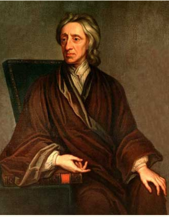
Filósofo y médico inglés, John Locke