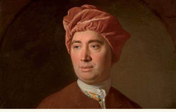
Filósofo escocés, David Hume

Afirma que la verdad no existe o que el ser humano es incapaz de conocerla