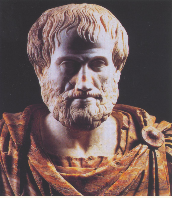
Filósofo griego, Aristóteles

Constructo social a partir de nuestra percepción