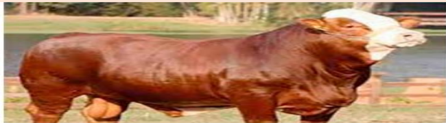
Macho Peso: 900 a 1,080 kg Los machos son grandes y musculosos tienen entre 70 a 95% de carne.

Los animales del triple propósito, se les considera que producen carne, huevos y pluma, o en bovinos leche, carne y piel etc.