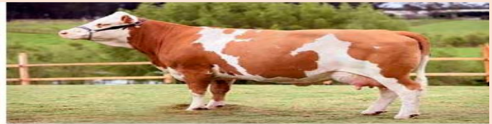
Hembra Peso: 560 a 750 kg Promedio producción de leche 6.300 a 15 litros diarios, las hembras son finas.