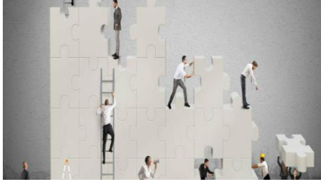
Genera la conciencia y te mueve a la acción