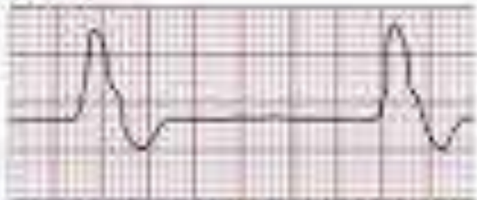
ACTIVIDAD ELÉCTRICA SIN PULSO AASE