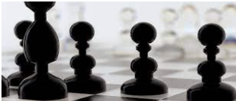
Concepto de conflicto

“Es la actividad mediante la cual ambas partes tratan de satisfacer sus necesidades, mejorando la propia posición y sistema de valores dando lugar a un nuevo valor” (Montaner, 1992, p. 12)