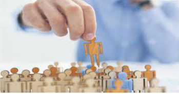
Concepto de conflicto

Es simplemente una dificultad que lleva a lo que es discutible, cuestionable o dudoso.