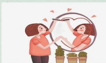
Imagen corporal, identidad y sentido general de valía, patrón emocional, postura, movimiento, voz Valora: Problemas con uno mismo, autoimagen, problemas conductuales