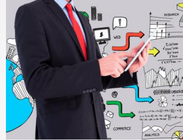
Enfoque de contingencia