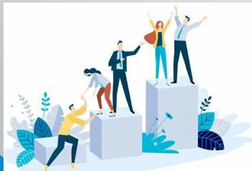
Efectividad del liderazgo