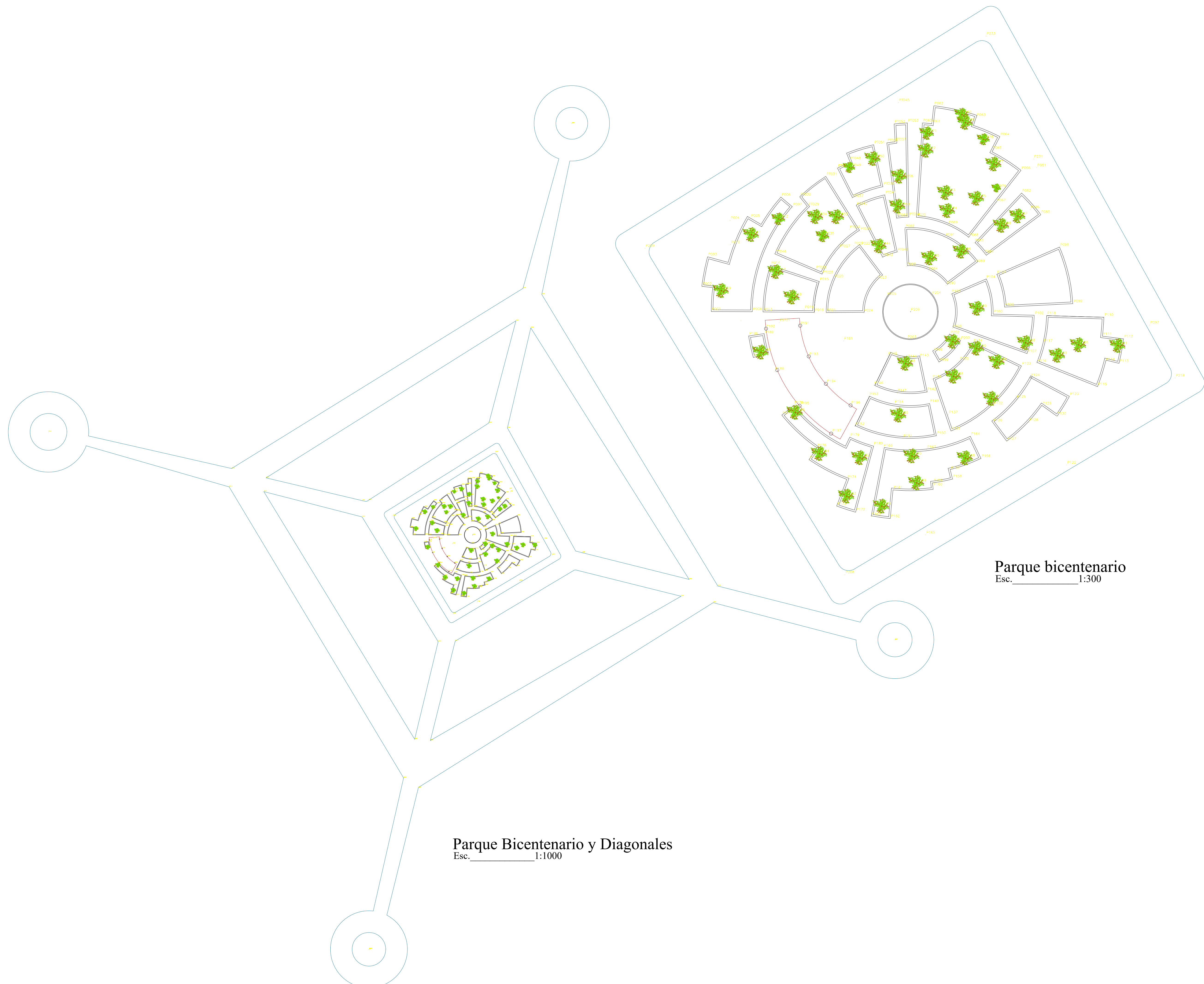
Parque Bicentenario y Diagonales Esc. 1:1000