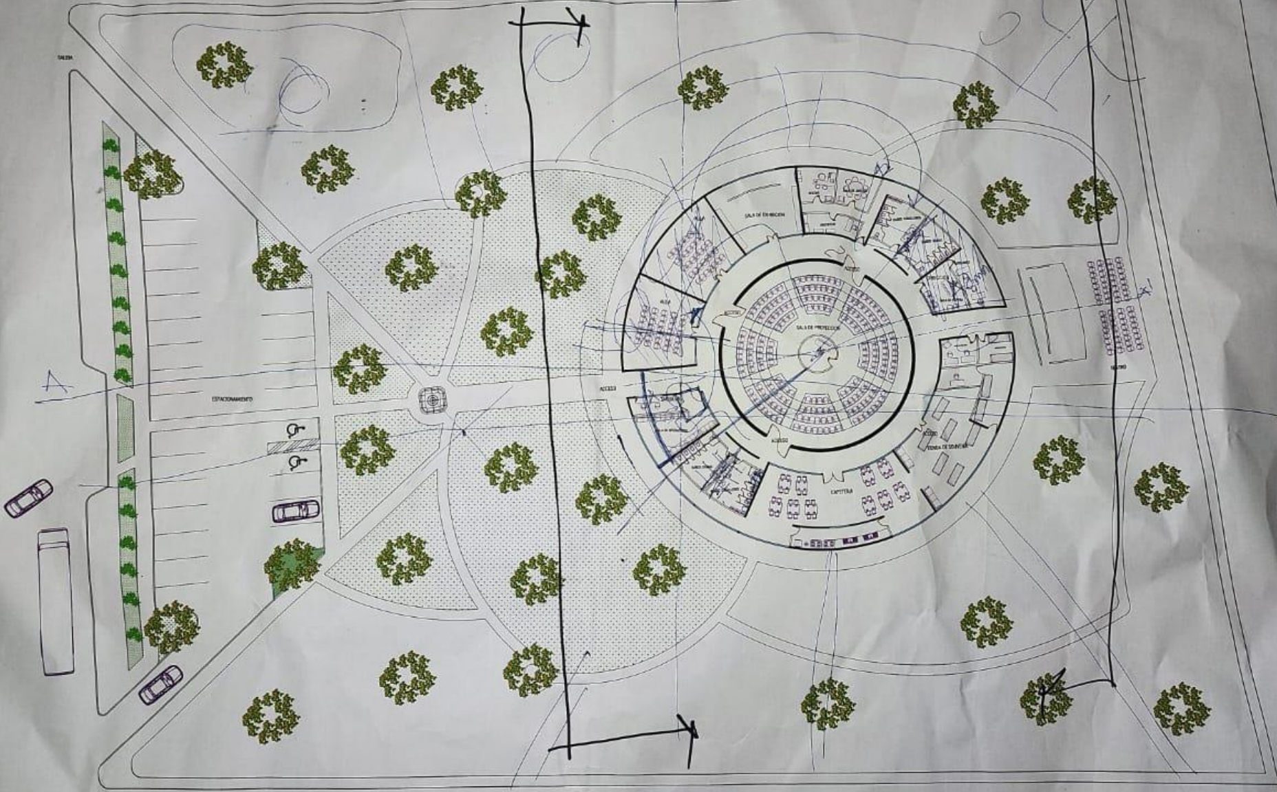
PLANTA ARQUITECTONICA DE CONJUNTO ESC... 1:200

ZONA ADMINISTRATIVA: DIRECCION SALA DE ESPERA SALA DE JUNTAS ARCHIVERO SANITARIOS AUXILIARES CUARTO DE VIGILANCIA BODEGA DE LIMPIO