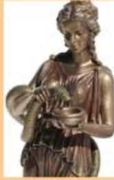
HYGIA: DIOSA GRIEGA DE LA BUENA SALUD