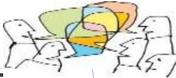
SPEAKS DIFERENT LANGUAJES