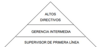
Figura 1.10 Nivel jerárquico de la estructura organizacional

remite a la conducta que toma el líder en relación con sus subordinados con la finalidad de alcanzar los objetivos o metas organizacionales.