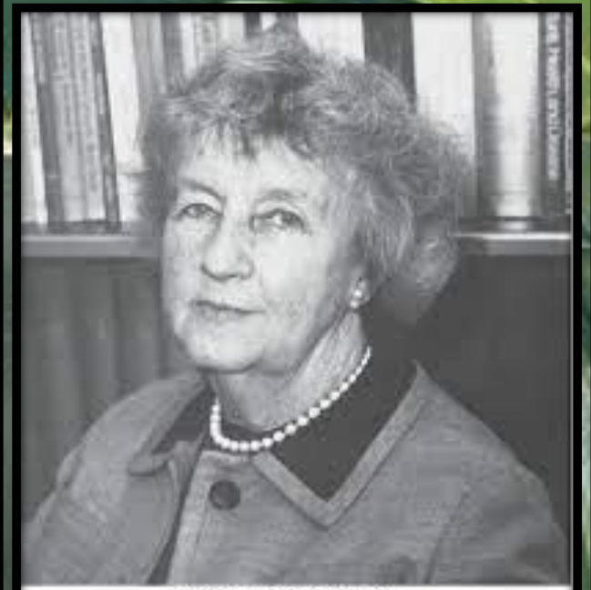
Virginia Henderson 1897-1996

Virginia Henderson nació en 1897 en Kansas y falleció el 19 de marzo de 1996 a la edad de 98 años. Desarrolló su interés por enfermería a partir de la Primera Guerra Mundial. Es ahí donde se destacó por asistir a sus semejantes. Estudió en Washington en 1918 a la edad de 21 años inicia sus estudios de enfermería en la Escuela de enfermería del ejército y Se graduó en 1921 y trabajó en Henry Street Visiting Nurse Service de Nueva York como enfermera visitadora.