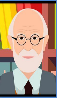
Sigmund Freud Desarrollo psicosexual.

El psicoanálisis y el desarrollo afectivo