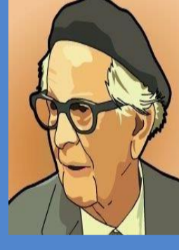
Jean Piaget teoría acerca del desarrollo de la inteligencia.

Teoría Socio-Histórica de Lev Vigotsky rol de contexto.