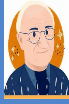
Albert Bandura teoría del aprendizaje social.