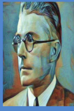
John Watson aprendizaje asociativo (clásico).