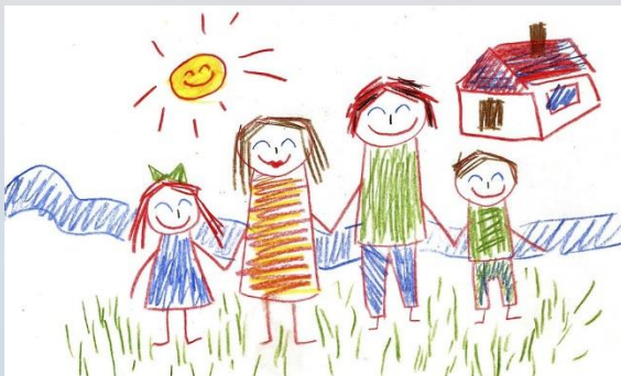
Ejemplo de dibujos realizados por niños de diferentes etapas evolutivas