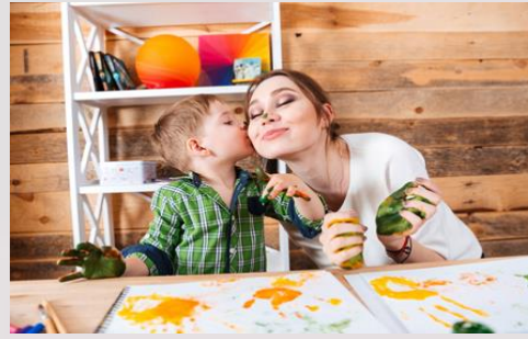
Aspectos emocionales y afectivos