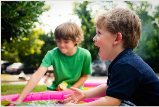
Revisión de los estudios y teorías en torno al juego