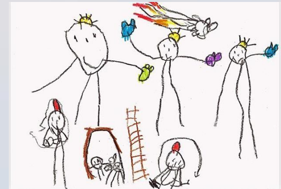
Evolución del dibujo