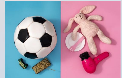
Desarrollo de los roles de género