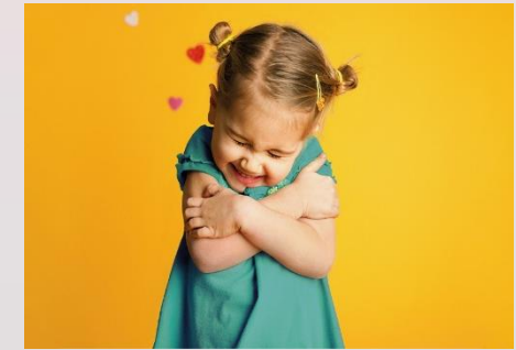
El conocimiento de sí mismo: autoconcepto y autoestima