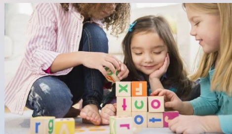
inteligencia operatoria concreta