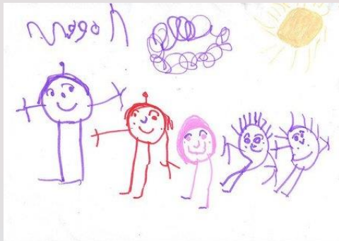
Prácticas: análisis de dibujos, estudio de casos