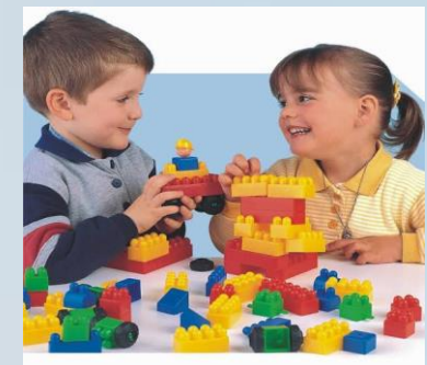
La inteligencia pre-operacional