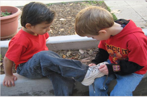
Las conductas prosociales