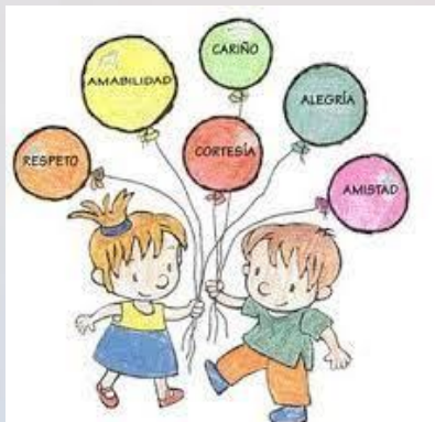
Aspectos psicosociales y desarrollo moral