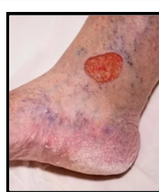
Ulceras por presión