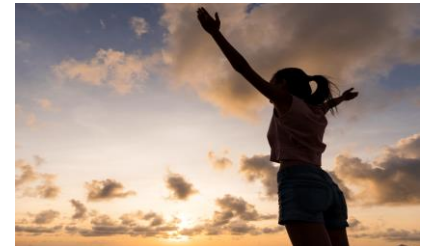
PIRAMIDE DE MASLOW

Maslow utilizó varios términos para denominarlo: «motivación de crecimiento», «necesidad de ser» y «autorrealización». Son las necesidades más elevadas, se hallan en la cima de la jerarquía. Se llega a ésta cuando todos los niveles anteriores han sido alcanzados y completados, al menos hasta cierto punto.