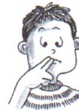
he is quiet