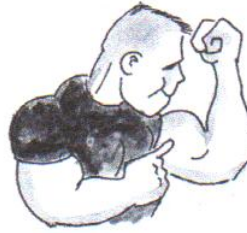
he is strong