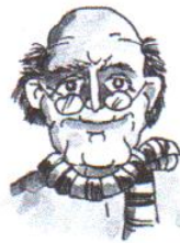
he is old