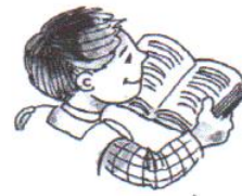
he is studious