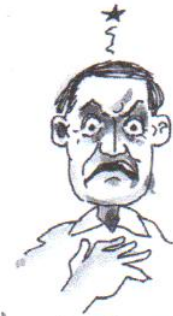
he has a temper