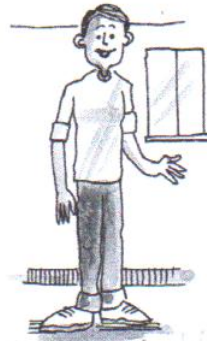
he is slim