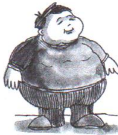
he is fat