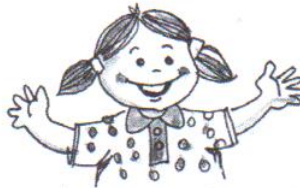
she is friendly