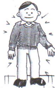
he is tall