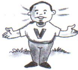
he is young