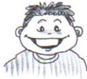
he is happy