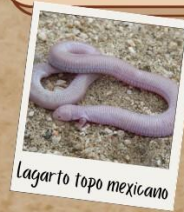
Lagarto topo mexicano

La lagartija topo cinco dedos, también conocida como ajolote de cinco dedos, asimismo como lagarto gusano de dos patas, lagarto topo mexicano, lagarto gusano de cinco dedos, culebrilla ciega de dos patas o lagarto ajolote ( Bipes biporus ) es una de las tres especies del género Bipes y la familia Bipedidae, y la única de los anfisbenios que conserva sus dos patas delanteras solamente.