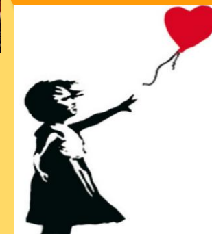
Imagen 3.10: https://daraespinaco.com/2014/09/06/el-desapego/

Cortar vínculo con aquella persona o de aquello con quien sentíamos apego, ya sea por muerte o rotura del vínculo.