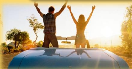
Imagen 4.11 1 derecho individual https://objetivismo.org/derechos-individuales/