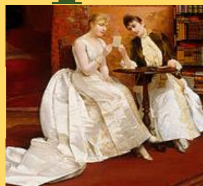
Imagen 3.7: https://es.wikipedia.org/wiki/Confidencia

Relación donde la confianza desplaza la ansiedad y donde estamos libres de abrirnos sin temor a perder el afecto del otro.