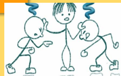
Imagen 4.1: https://usbmed.edu.co/noticias/ampliacion-informacion/artmid/1732/artleid/4675/resolucion-de-conflictos-y-toma-de-decisiones

Los conflictos pueden comprenderse y reconocerse, pueden dar fin a la opresión y estimular una renovación en las relaciones.