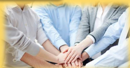
Imagen 4.11 2 derecho colectivo https://fc-abogados.com/es/los-derechos-colectivos-de-los-trabajadores/

El derecho colectivo recae sobre una comunidad entera y el derecho individual recae sobre una persona.