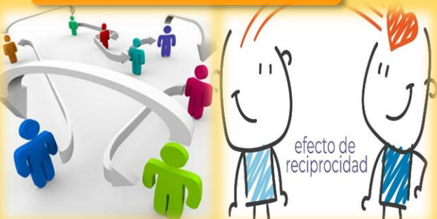
Imagen 3.11: intercambio social https://gestiondeltalentohumano.wordpress.com/2014/08/10/intercambio-social/