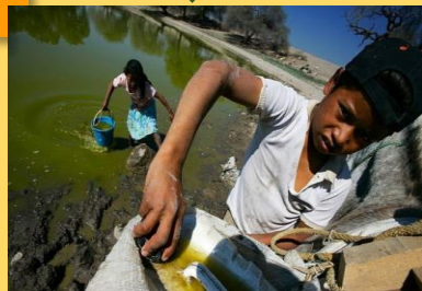
Imagen 4.2: https://www.bbc.com/mundo/noticias-49082868#:~:text=La%20tragedia%20de%20los%20comunes%22%20es%20que%20los%20recursos%20naturales,plazo%2C%20son%20destruidos%20o%20agotados.

Los recursos naturales de uso colectivo inevitablemente derivan en una sobreexplotación y, a largo plazo, son destruidos o agotados.