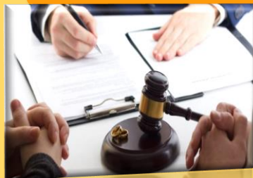
Imagen 3.9: https://concepto.de/divorcio/

Los individualistas se casan "hasta que la falta de amor los separe" y los colectivistas se "casan de por vida".