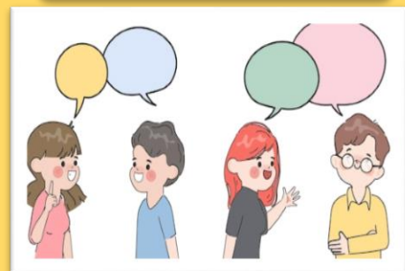
imagen 4.9: https://www.freepik.es/vector-premium/comunicacion-personas-dibujadas-mano-hablando-chateando-concepto-discusion_24651407.htm