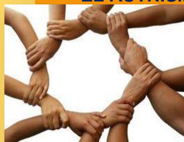
Imagen 3.15: https://www.ecured.cu/Altruismo