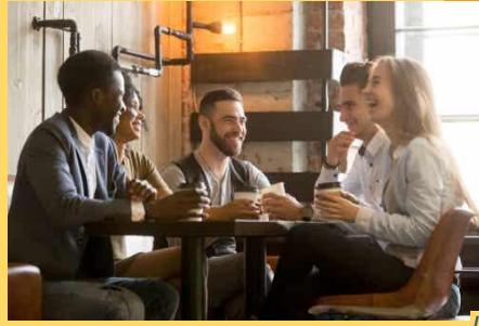
Imagen 3.2: https://www.psicok.es/psicok-blog/2018/4/29/factores-que-intervienen-en-la-atraccion-interpersonal

La buscamos para sentirnos apoyados por las relaciones cercanas e íntimas y así sentirnos más sanos y felices.