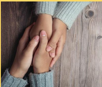
Imagen 4.6: https://es.linkedin.com/pulse/el-poder-del-contacto-f%C3%ADsico-en-la-comunicaci%C3%B3n-nhuna-daiana-jim%C3%A9nez

El contacto predice una disminución de prejuicios y predice la tolerancia