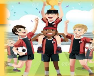
Imagen 4.8:

Lo que los fanáticos del mundo entero sueñan con ver a su país como triunfador