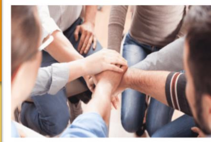
Imagen 3.12: https://www.pabsmr.org/maneras-sencillas-en-las-que-podemos-ayudar-a-otros/

Algunas circunstancias que pueden influir en ayudar al alguien puede ser cuando tenemos presiones de tiempo y número de espectadores