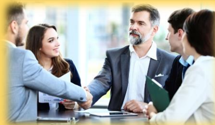
Imagen 4.10: https://www.notariosenred.com/2015/10/la-conciliacion-si-pero-por-que-ante-notario/

GRIT: valor o temple, para ejemplificar la determinación que requerían.