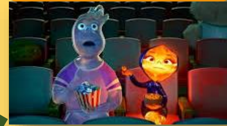
Imagen 3.3: https://www.televisa.com/canal5/peliculas/elemental-los-opuestos-se-atraen-en-el-trailer-de-la-pelicula-de-pixar

Aquellos estímulos, actividades, conductas, características o personas que le resultan a uno interesantes