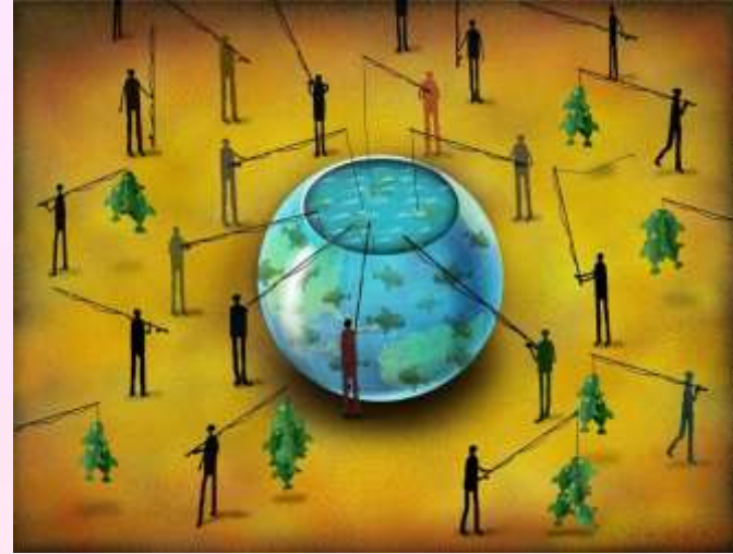
Estrategia de los comunes