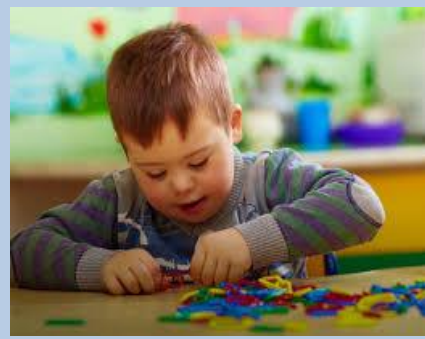
Los juegos en esta etapa son muy importantes para ir adquiriendo nuevos conocimientos