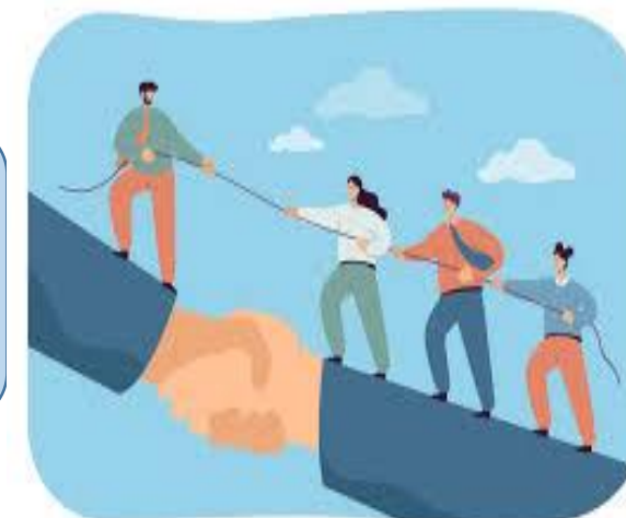
Liderazgo: Cualidades del buen líder SVAE

UDS (2023), antología dirección y liderazgo p.18