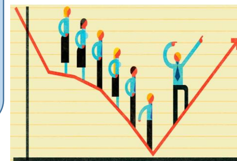
Liderazgo y dirección de personas 2.0

UDS (2023), antología dirección y liderazgo p.15