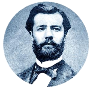
Biografía de Henry Fayol

UDS (2023), antología dirección y liderazgo p.11