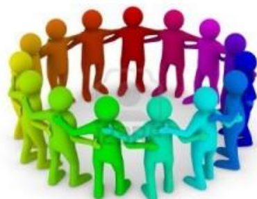
Dirección y Liderazgo

UDS (2023), antología dirección y liderazgo p.21