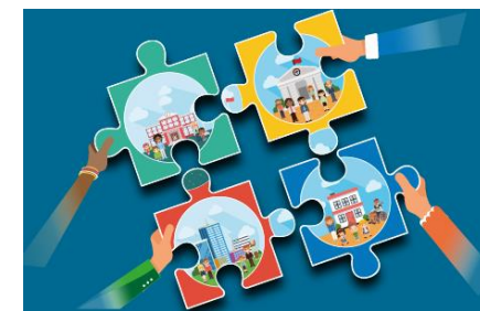
Generalidades/Secretaría distrital de planeación. Fuente:

Universidad Del Sureste [UDS], (2023) antología dirección y liderazgo p.11