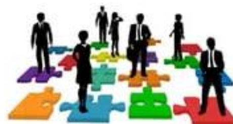
Las etapas de dirección/PPT