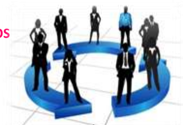
ETAPAS DE DIRECCIÓN