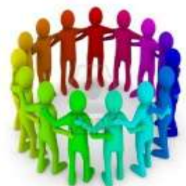
IMPORTANCIA DE DIRECCION

Universidad del sureste [UDS], (2023) antología dirección y liderazgo pág. 19