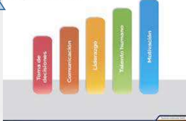
ETAPAS DE DIRECCION