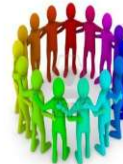
DIRECCION Y LIDERAZGO

Universidad del sureste [UDS], (2023) antología dirección y liderazgo pág. 33