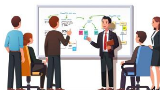
Importancia de Dirección