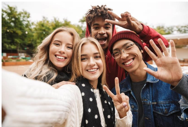
Va desde los 12 hasta los 18 años