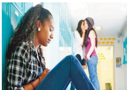
Problemas de autoestima