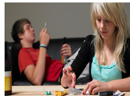
Riesgos de adicciones