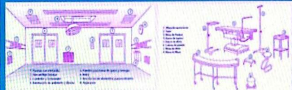
LA ZONA BLANCA, SALA DE QUIROFANO