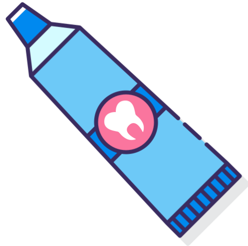
PASTA CON FLOUR