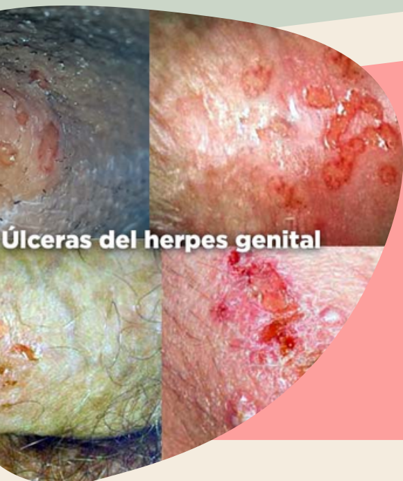
Úlceras del herpes genital