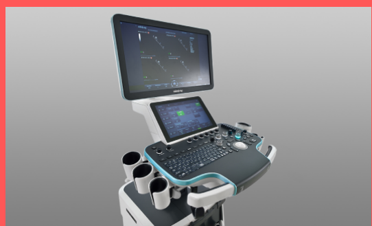
3.-Equipo de ultrasonido