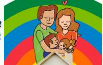
Concepto de familia y tipos de familia