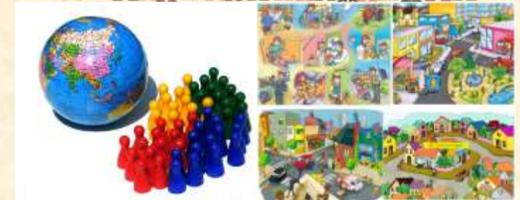
Concepto de comunidad