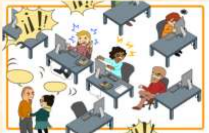
Influencia sobre la salud