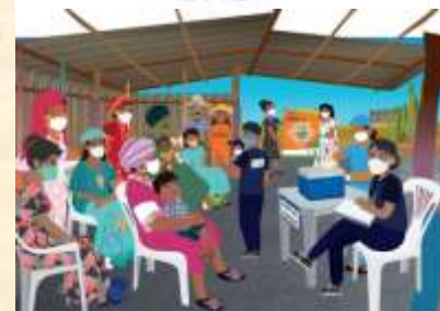
Formas de la participación comunitaria