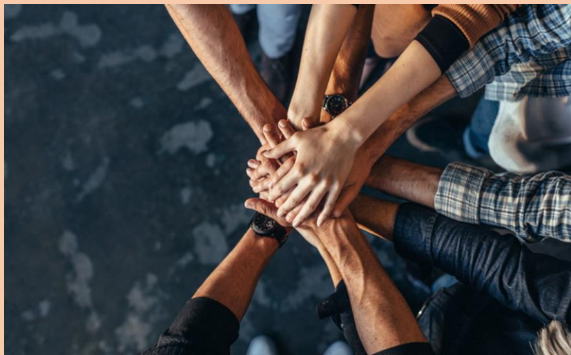
Cohesión de grupo