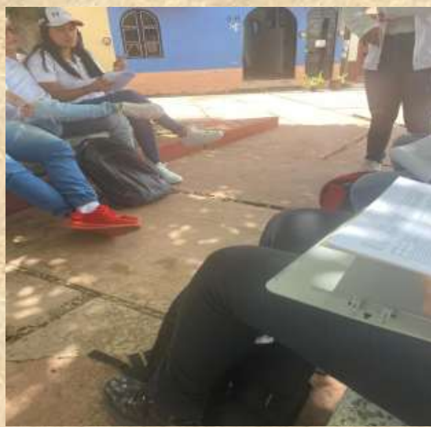
Nos reunimos en el parque de Guadalupe alrededor de las 8 de la mañana para iniciar el censo