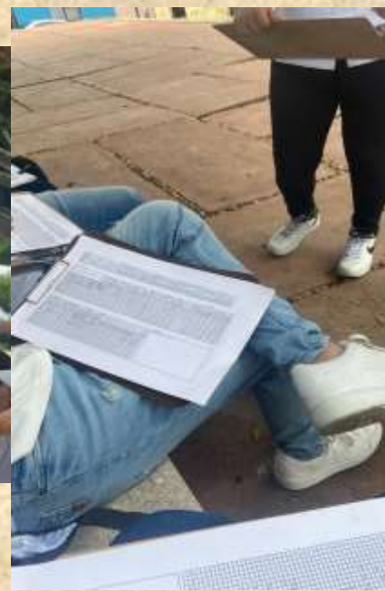
Después de un rato censando no reunimos para chechar si todo iba bien