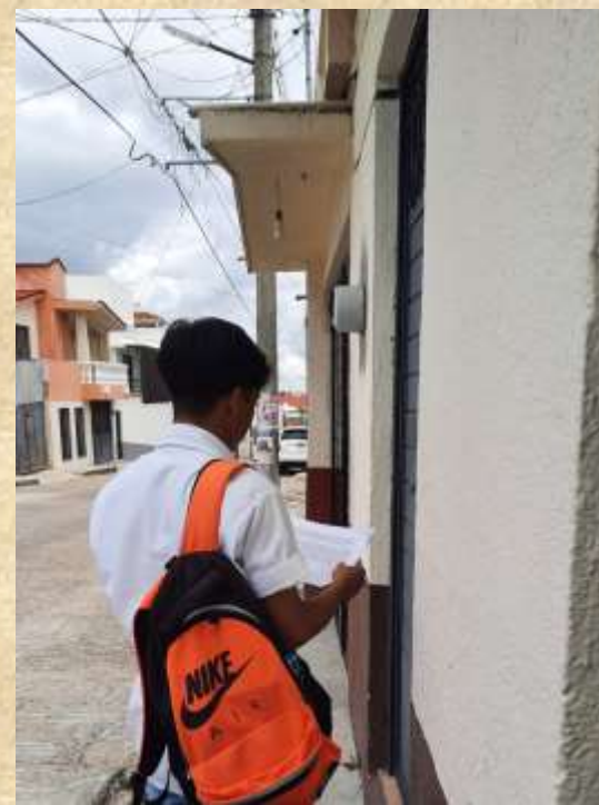
Seguimos con las encuestas