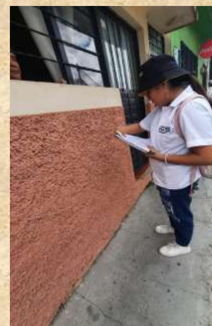
Rendirse no fue una opción