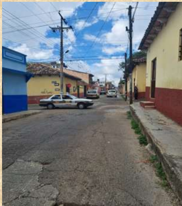
Calles tranquilas, pero siempre actitud positiva