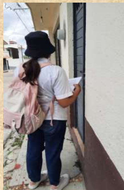
En ocasiones no nos iba tan bien