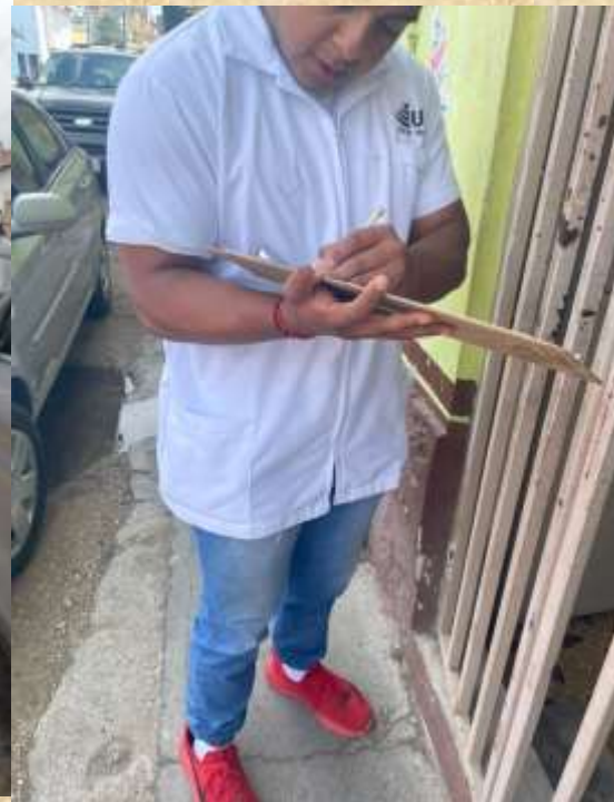
Iniciamos con las primeras encuestas