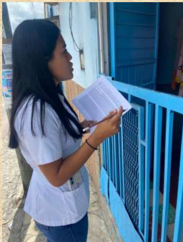
La mayoría de personas encuestadas son de edad mayor