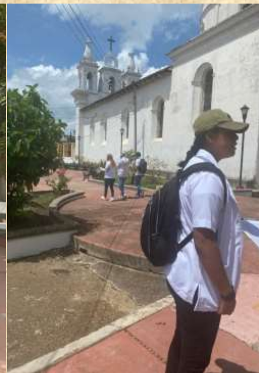
Iniciamos censos, cada quien se dirige a su sección