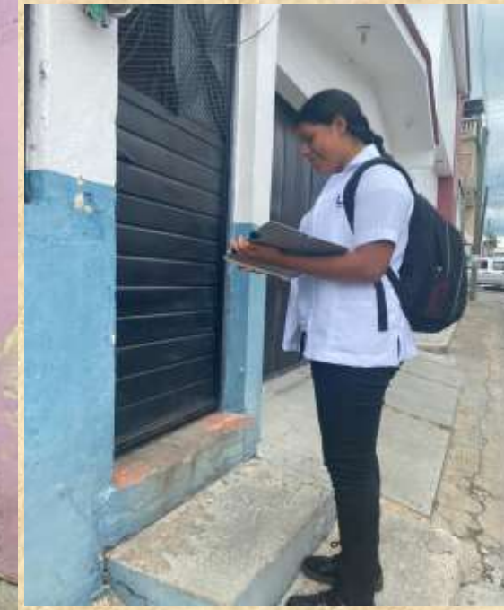
Todos iniciamos con éxito