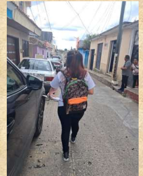
Nos tomaba tiempo recorrer las calles