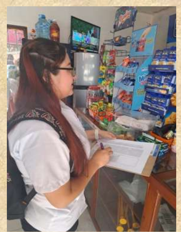
Los comercios fueron de gran ayuda