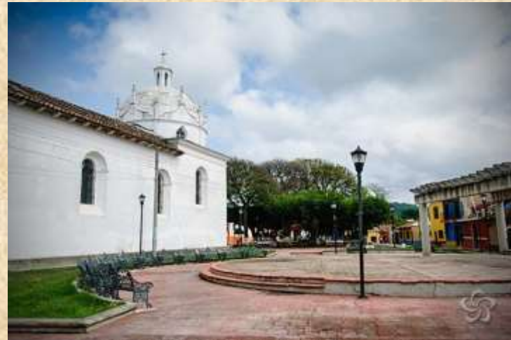
Primeramente elegimos el barrio de Guadalupe