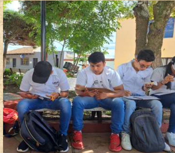
Resolvemos pequeñas dudas y seccionamos el lugar para encuestar