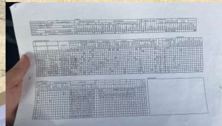
Finalmente volvimos a checar datos y finalmente terminamos