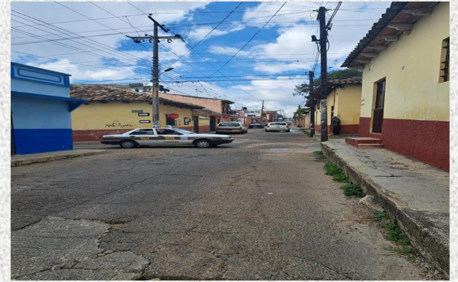
Seguimos encuestando a personas, ocupadas algunas de ellas