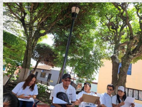
Resolvimos dudas en equipo, y nos dividimos en que calles o avenidas les tocaría a cada quien.