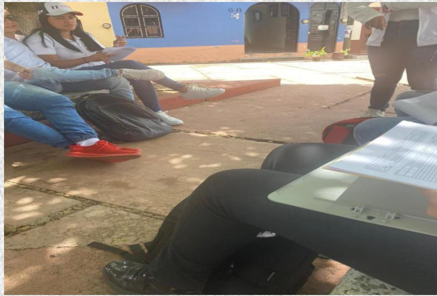
Nos reunimos en el barrio de Guadalupe todos los integrantes (BAM).