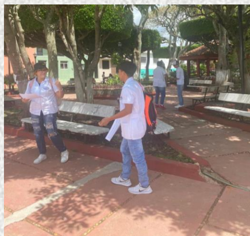
Iniciamos el censo, cada quien se dirige en la sección que le corresponde.