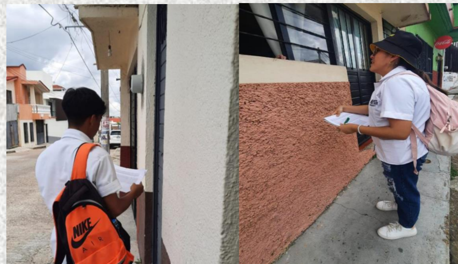
Casa por casa, con calma, pero la actitud siempre positiva