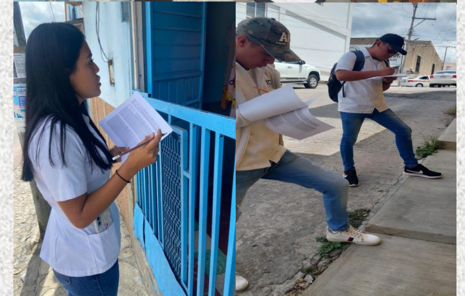
Segundo día de censo