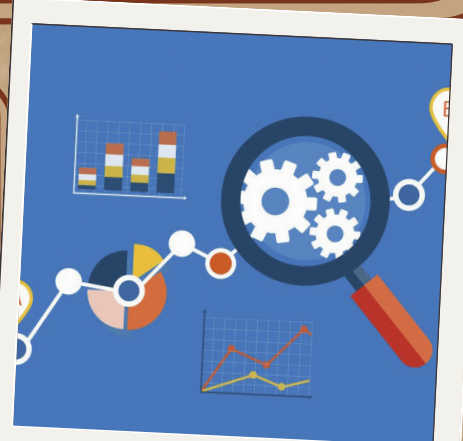
estandarizar los procesos

Una vez que el diagrama de flujo está listo, puedes reutilizarlo para otros proyectos o procesos similares. A la larga, tanto el equipo como tú ahorraréis tiempo (y evitarán el estrés).