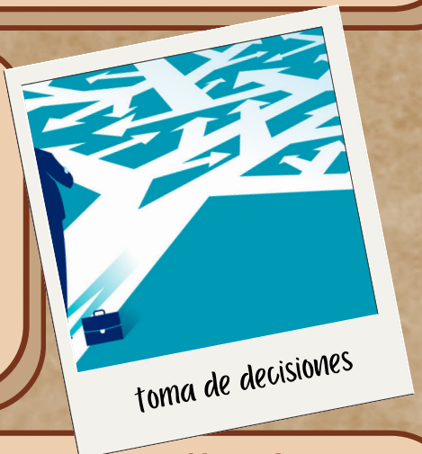
toma de decisiones

Representa visualmente un proceso que pueda facilitar la asignación de tareas a los miembros del equipo y organiza el trabajo del grupo de manera que todo fluya mejor.