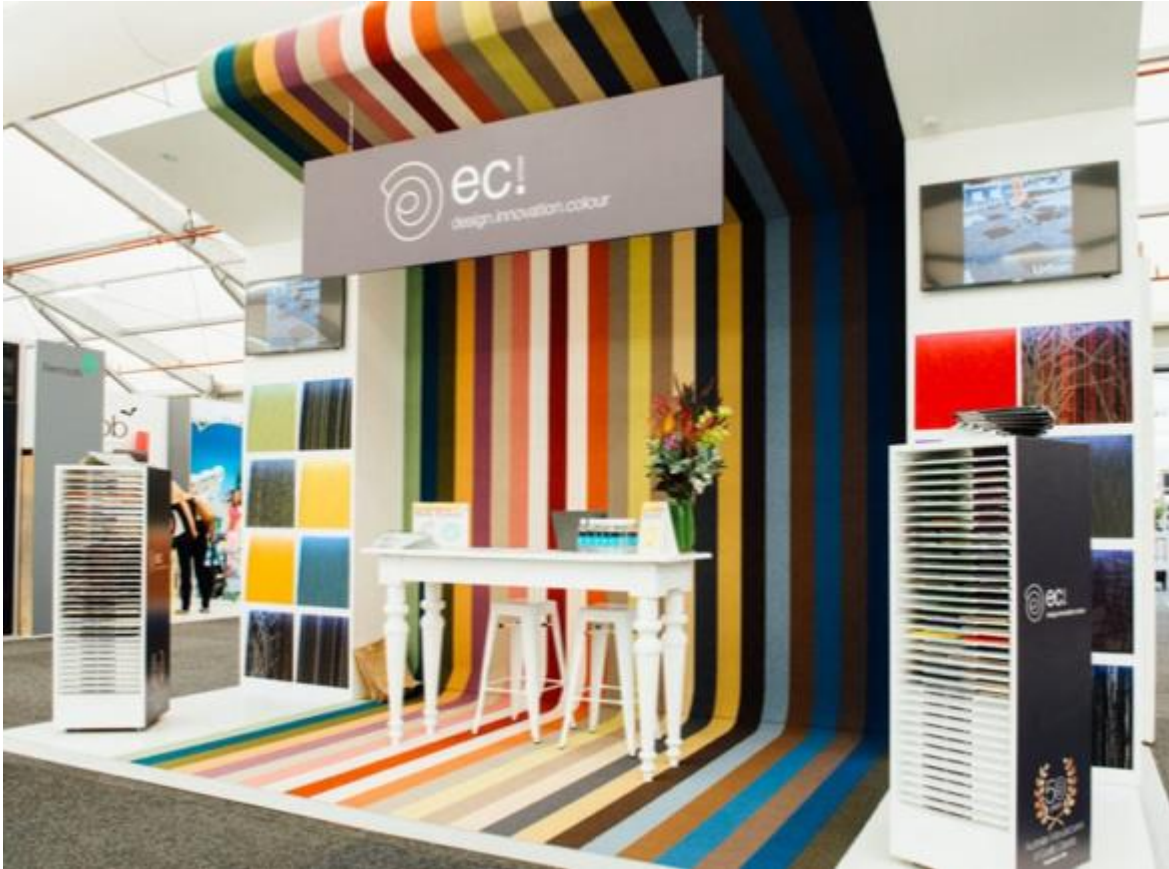
Imagen de referencia tomada de: (HELLOPRINT)