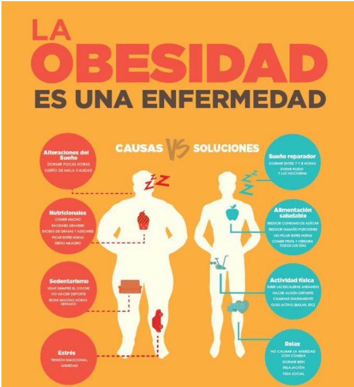
Imagen de referencia tomada de: (SALUD E. )