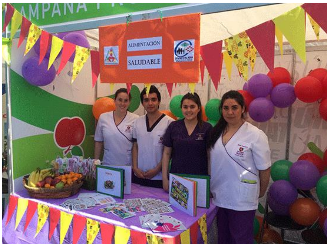
Imagen de referencia tomada de: (MAYOR)