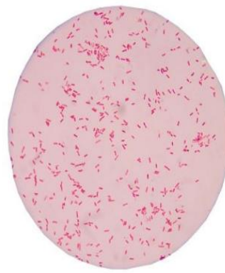
Bacterias Gram Negativas