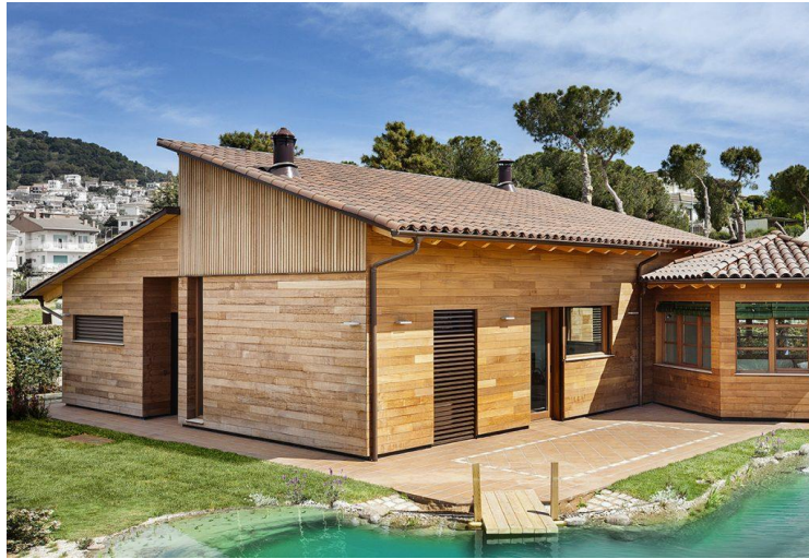
(Marnew controls, s.f.)